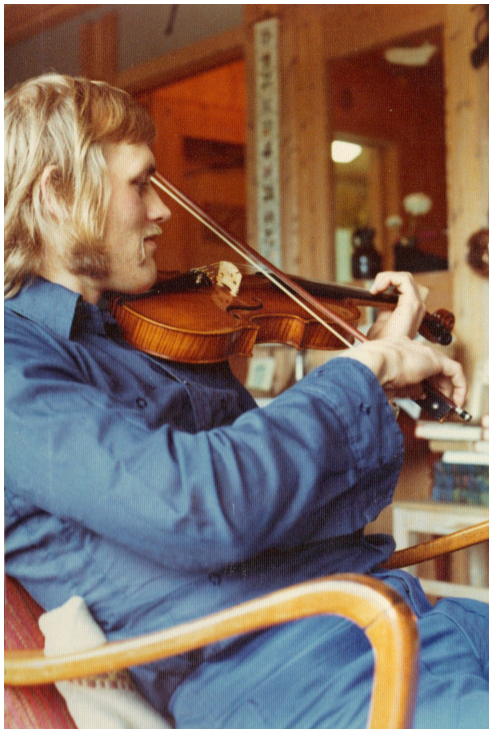
Spelstund heime, 1975.