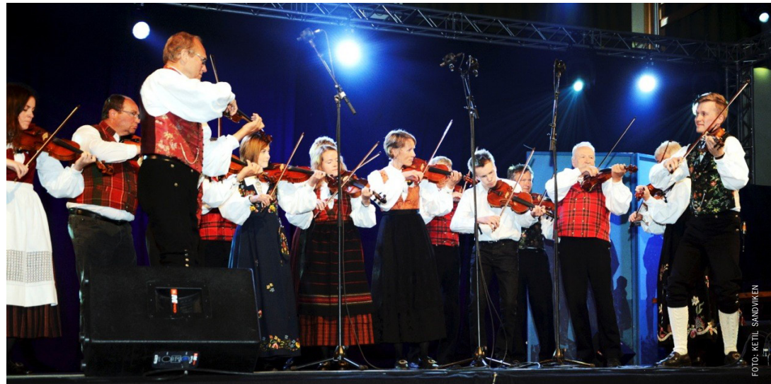
Lom spelmannslag. Landskappleiken på Fagernes i 2015.

strings", with the ability to vary and improvise. All the same, he had his own personal style, even though his ideals changed somewhat over the years, which is reasonable. His clear, strong tone gradually became more emphasized.