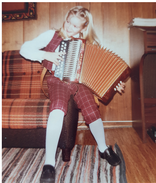
Lykkelig med belg i 1982