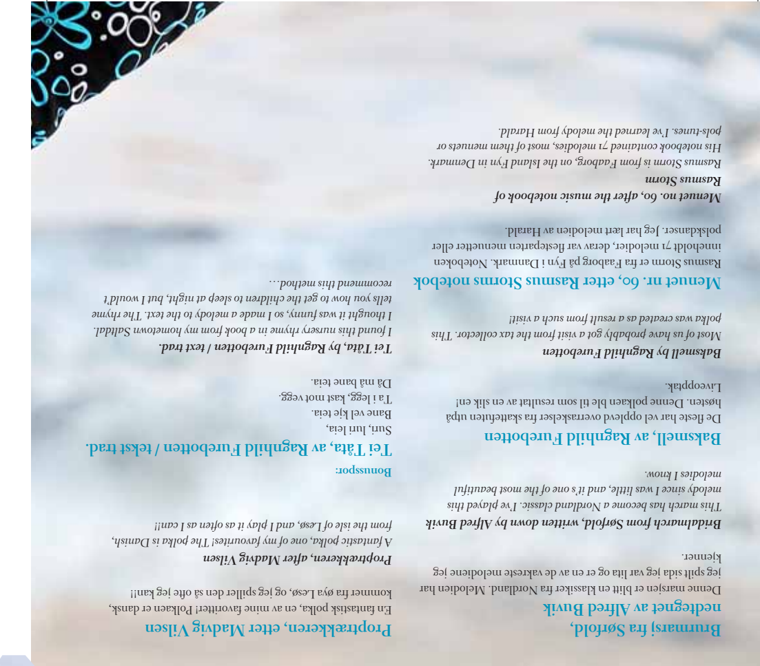
bottom of page 2 tray side