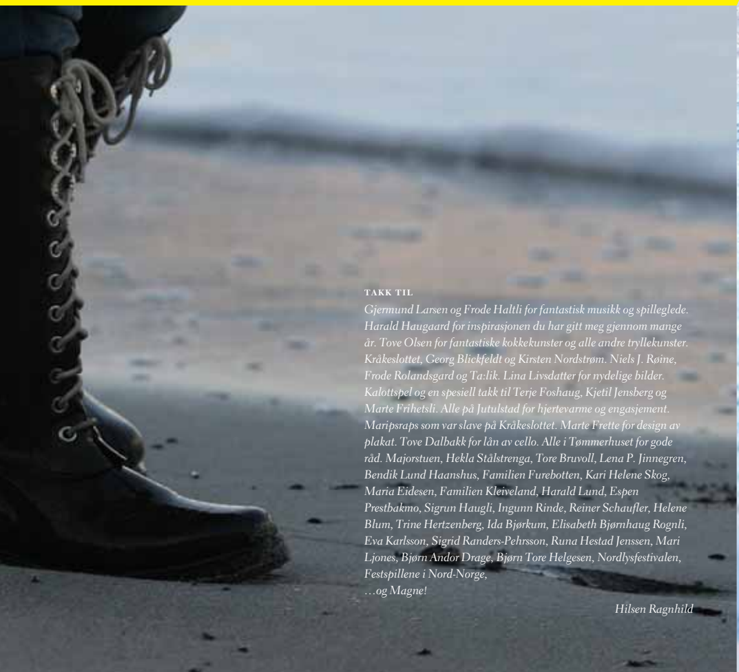
bottom of page 1 cover side